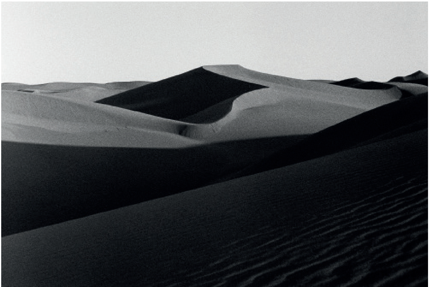
Dasht-e Lut, Analog photography. c print 160x107 cm. 2017