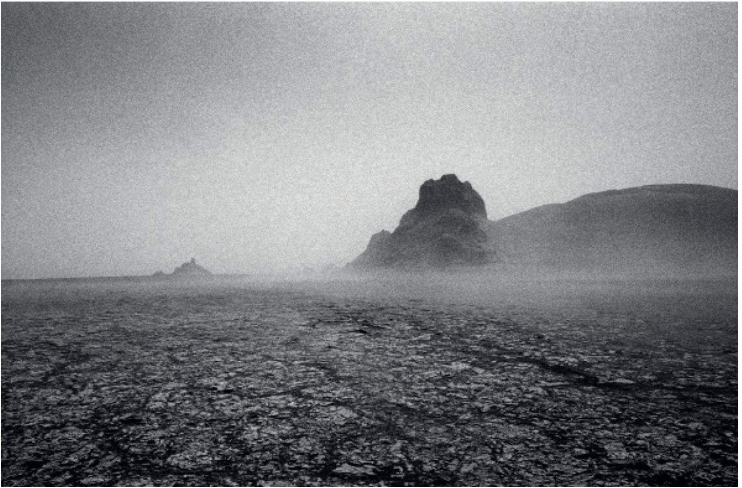
Dasht-e Lut, Analog photography. c print 60x41cm. 2017