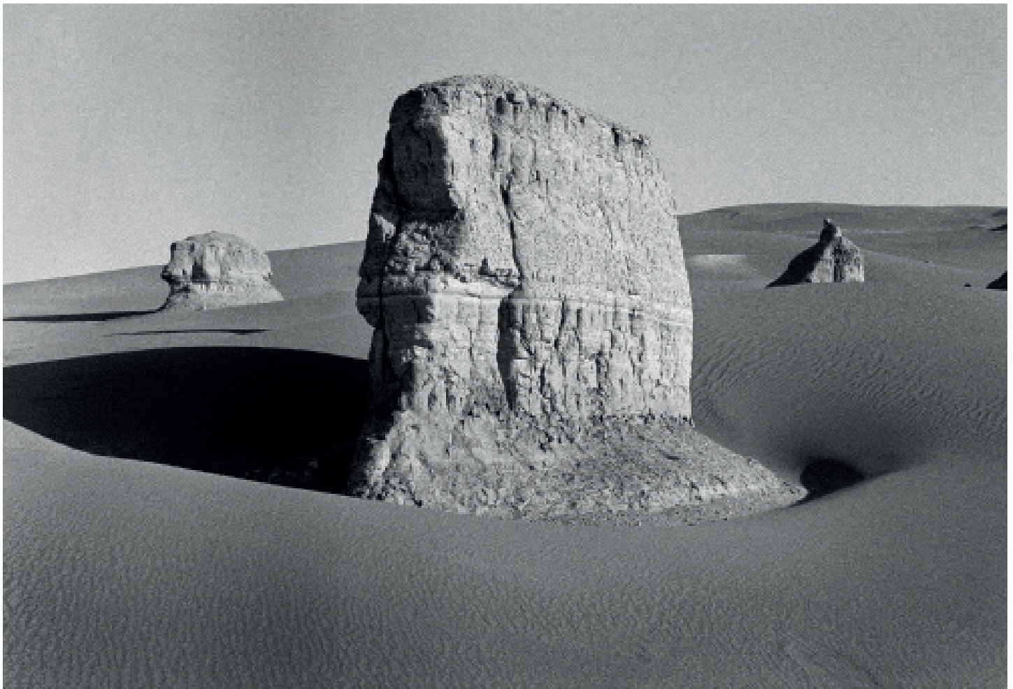
Dasht-e Lut, Analog photography. c print 60x41cm. 2017