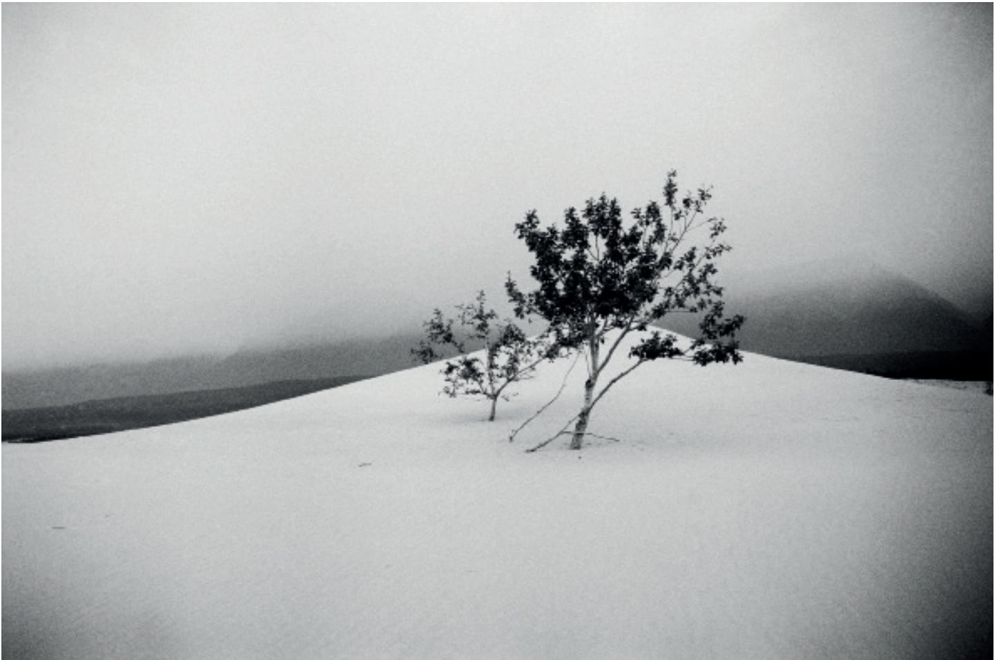
Chara Sands, Analog photography. c print 60x41cm. 2015