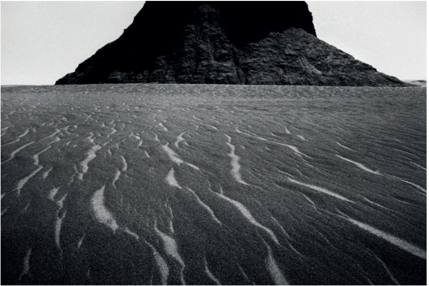
Dasht-e Lut, Analog photography. c print 60x41cm. 2017