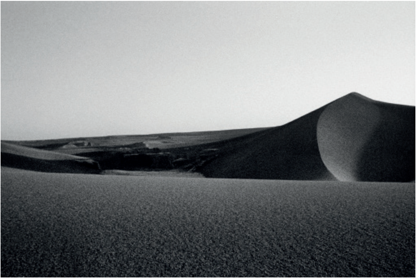
Dasht-e Lut, Analog photography. c print print 60x41cm. 2016