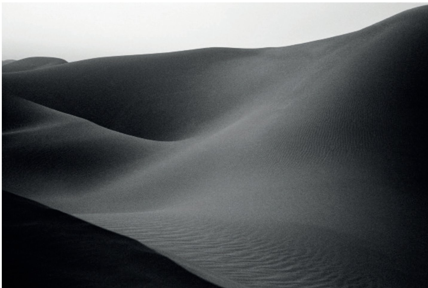
Liwa, Empty Corner, Analog photography. 60x41cm. c print 2015